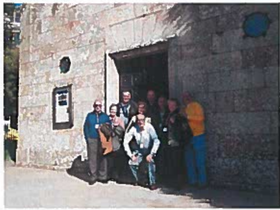
Curso de formación en matrimonio y familia, Silleda