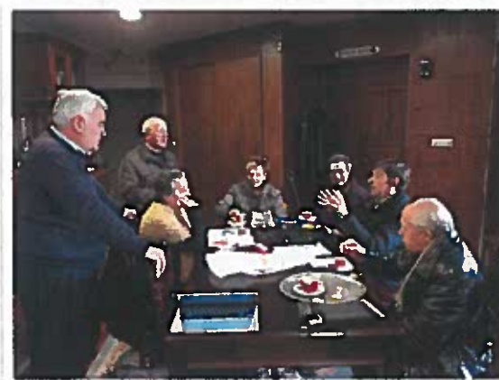
Preparando la Semana Santa