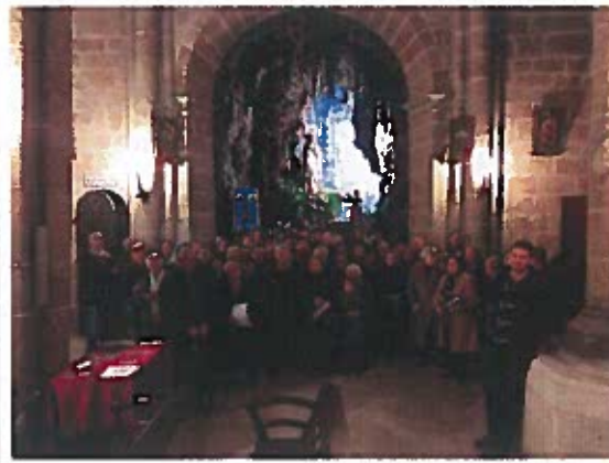
Fiesta de Nuestra Señora de Lourdes