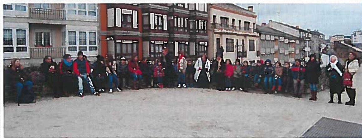
Excursión de Navidad de la Catequesis Parroquial de la Unidad Pastoral de Betanzos