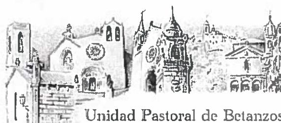
Unidad Pastoral de Betanzos