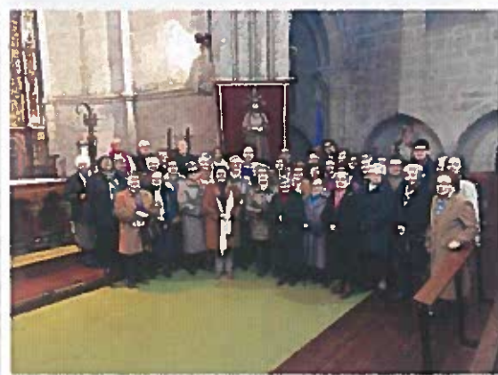
Fiesta del Nazareno