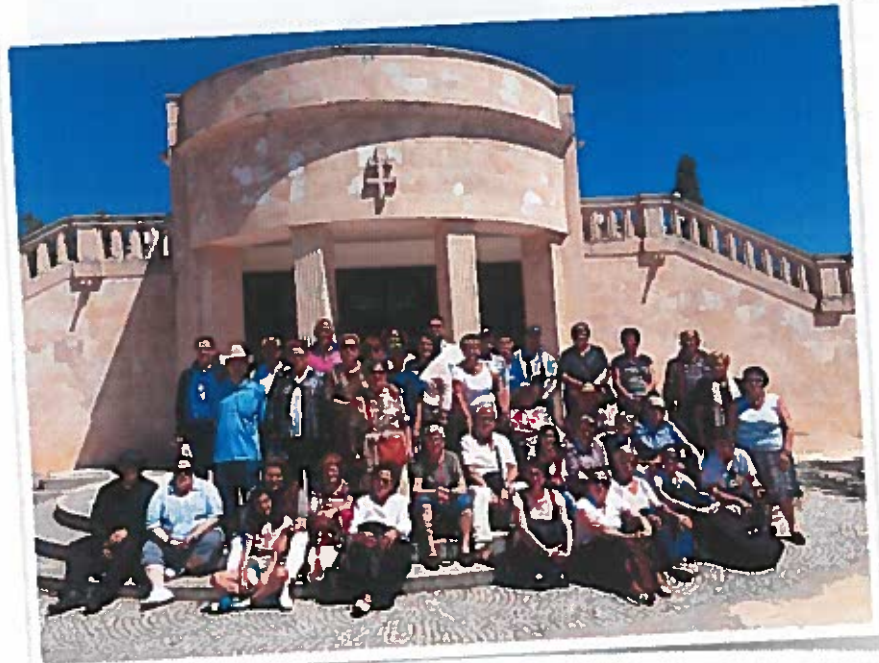
Peregrinación a Fátima 17 y 18 de mayo de 2014