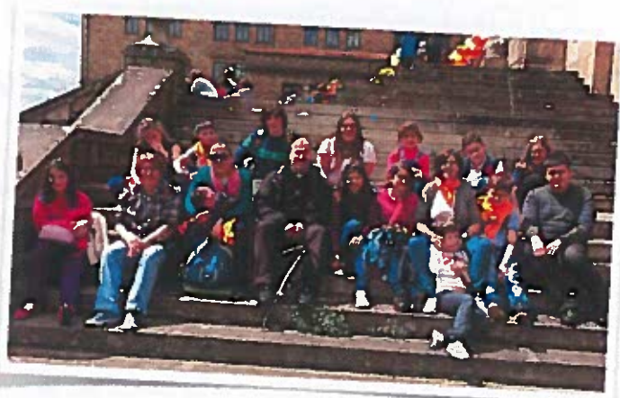
II Encuentro Diocesano de Niños 1 de mayo de 2014