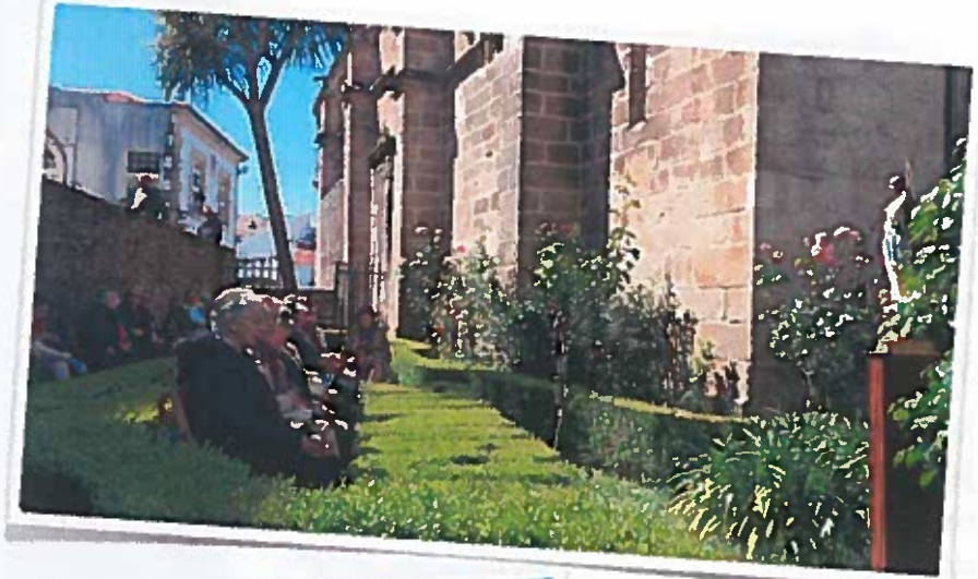
Rosario en el jardín de Santa María do Azogue Domingos de mayo de 2014