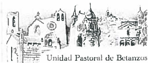
Unidad Pastoral de Betanzos